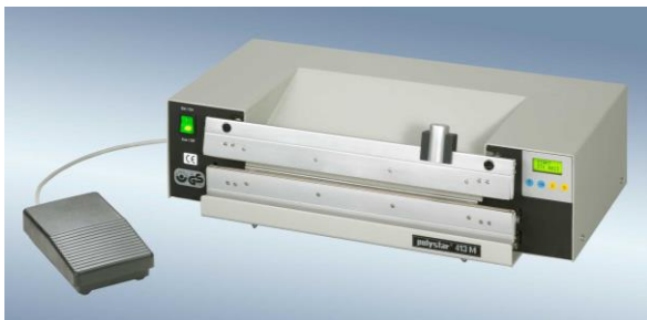
polystar® 413 M 带切割机