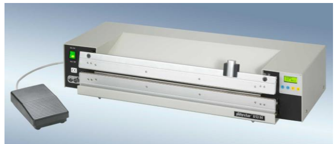
polystar® 613 M 带切割机